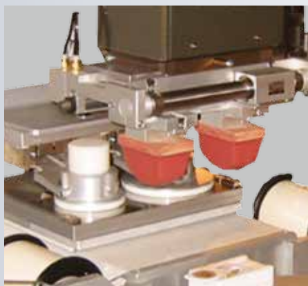
MS 250 Tamponverschiebung